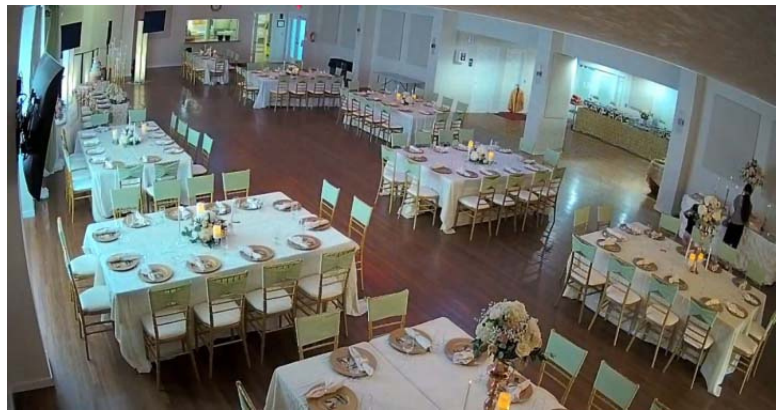
Sala recreativa de Bayshore Gardens: antes (izquierda) y después (derecha).